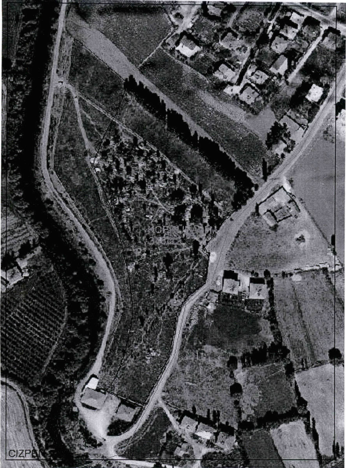
Resim-1 Kerpetenlik Mezarlığı (Kavak Ağaçlarının Kesileceği yer)