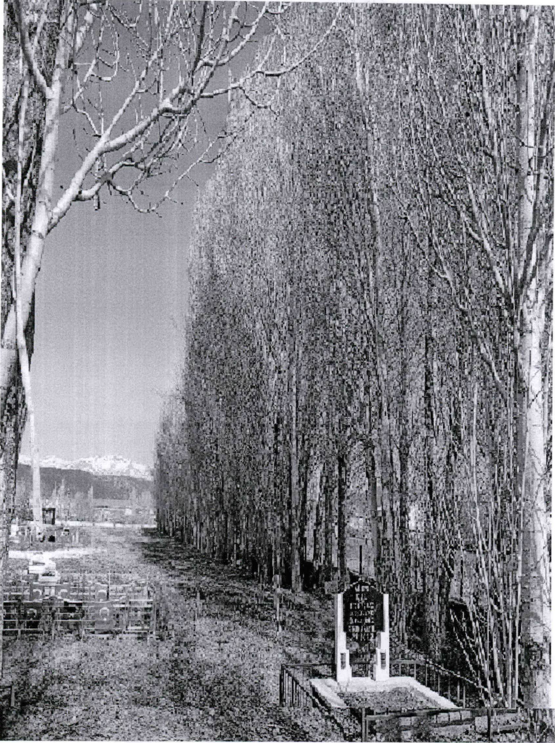
Resim-3 Kerpetenlik Mezarlığı (Kavak Ağaçlarının Kesileceği yer)