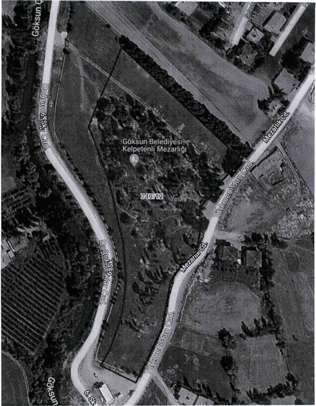
Resim-2-Kerpetenlik Mezarlığı (Kavak Ağaçlarının Kesileceği yer)